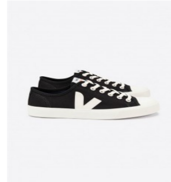
Tênis 100% veganos, que utilizam algodão orgânico além do couro curtido com tanino vegetal e borracha nativa da Amazônia