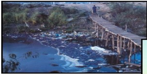
Poluição da água