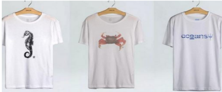
Camisas de algodão orgânico