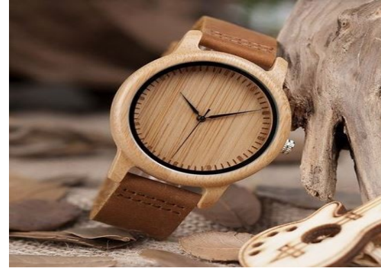
Relógio feito de madeira e bambu