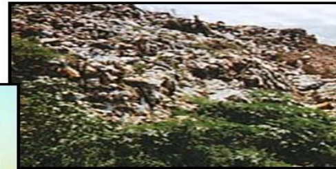
Poluição do solo