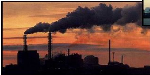
Poluição do ar